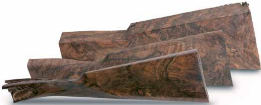
Culatas de madera de nogal escogidas por su veteado. Specially selected walnut stocks.

A careful selection of the materials is the basis for the successful development of the 100% hand made craftsmanship of our guns.