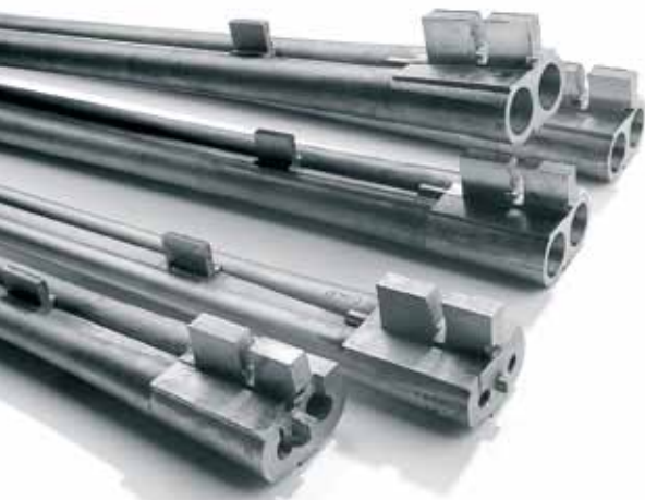
Cañones y básculas de acero forjado especial. Barrels and receivers of drop forged steel selected quality.