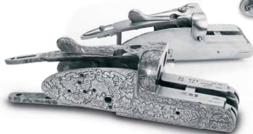
Llaves de acero especial de diseño exclusivo. Sidelocks of selected steel under exclusive design.