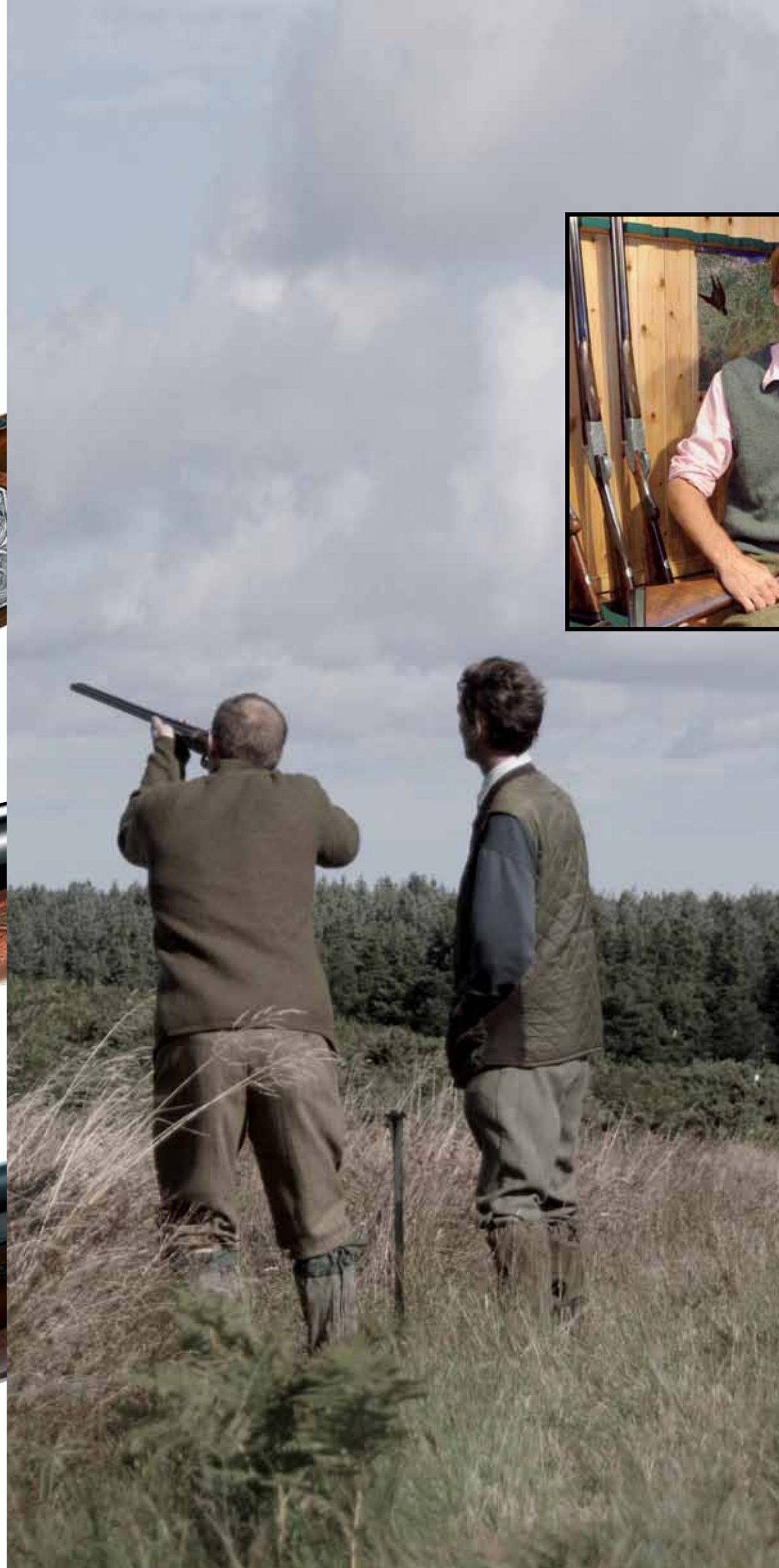
Ralph George Algernon Percy Duque de Northumberland

I was so impressed with a pair of GRULLA guns belonging to a spanish friend, that I ordered a pair for my son, and one for me. I have always shot with a pair of Purdeys, but both pairs of GRULLA have exceeded my expectations in the quality of workmanship, and reliability. The balance is excellent, the guns can take the heavy cartridges needed for long-range wildfowl and pheasants, without complaint, and they cost a fraction of the price of "best" English guns.